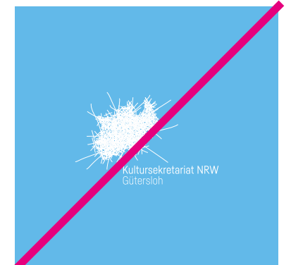
Es gibt auch keine negative Logo-Variante, auch nicht nur Schrift oder Logoelement!