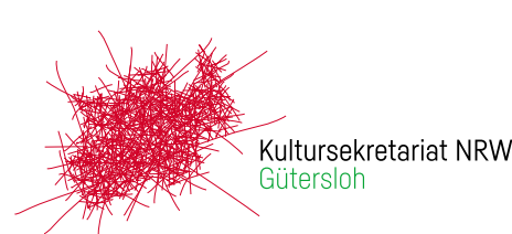
Logo-Variante B – quer

» Logo-Variante B wird nur dann eingesetzt, wenn Logo-Variante A aus Platzgründen bei den einzusetzenden Off- und Online-Medien nicht funktioniert.