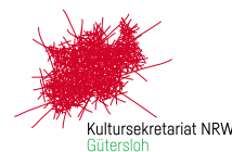
Logo frei auf weißer Fläche

» Bei der Platzierung auf farbigen Flächen muss um das Logo ein weißer Schutzraum stehen. Dieser Schutzraum ist schon in den jeweiligen Datei-Varianten angelegt.