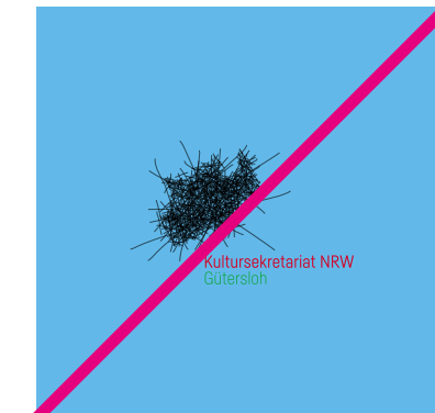
Es sind keine Änderungen der Farben innerhalb des Logos erlaubt!