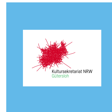
Logo mit weißem Schutzraum auf vollfarbiger Fläche