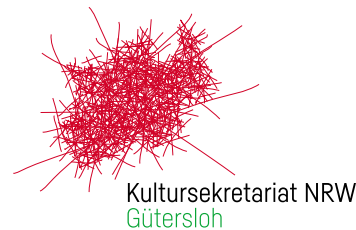
Logo-Variante A – hoch

» Logo-Variante A ist das zu bevorzugende Logo und sollte möglichst bei allen einzusetzenden Off- und Online-Medien zur Anwendung kommen.